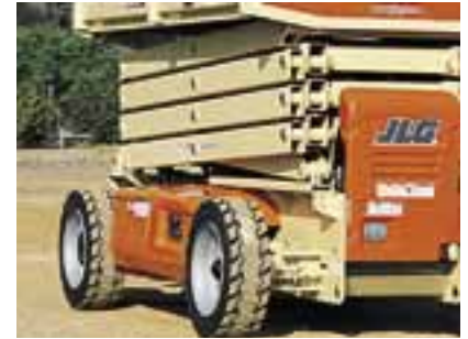
Optional All-Wheel Drive Provides Superior Performance On or Off Slab

*ตัวเลือกบางอย่างหรือมาตรฐานของประเทศอาจทำให้น้ำหนักเพิ่มขึ้น